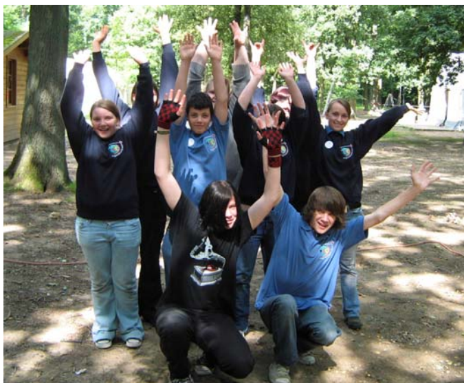
Immer gut drauf: Die Viersener JRK-Gruppe

Am zweiten Tag begannen dann die Aufgaben für die einzelnen Gruppen. Der erste Teil bestand aus