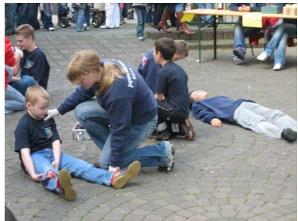
2006 wurde groß gefeiert: 110 Jahre DRK und 10 Jahre JRK gaben Anlass für einen Tag der offenen Tür. Die Kids stellten dort ihre Kenntnisse in Erster-Hilfe unter Beweis.

Die Schiefbahner durften die Willicher DRK'ler bei den Diensten in der Jakob-Franzen Halle begleiten, wo die Musicals „Bibi Blocksberg“ und „Benjamin Blümchen“ aufgeführt wurden. Beiden Gruppen macht es Spaß, das Kinderstück bei den Neersener Schloßfestspielen anzuschauen und mit zu betreuen. Oft sind die JRK'ler bei den großen San-Diensten oder Blutspendeterminen dabei und können vieles von den DRK'lern lernen und schon kleine Aufgaben übernehmen.